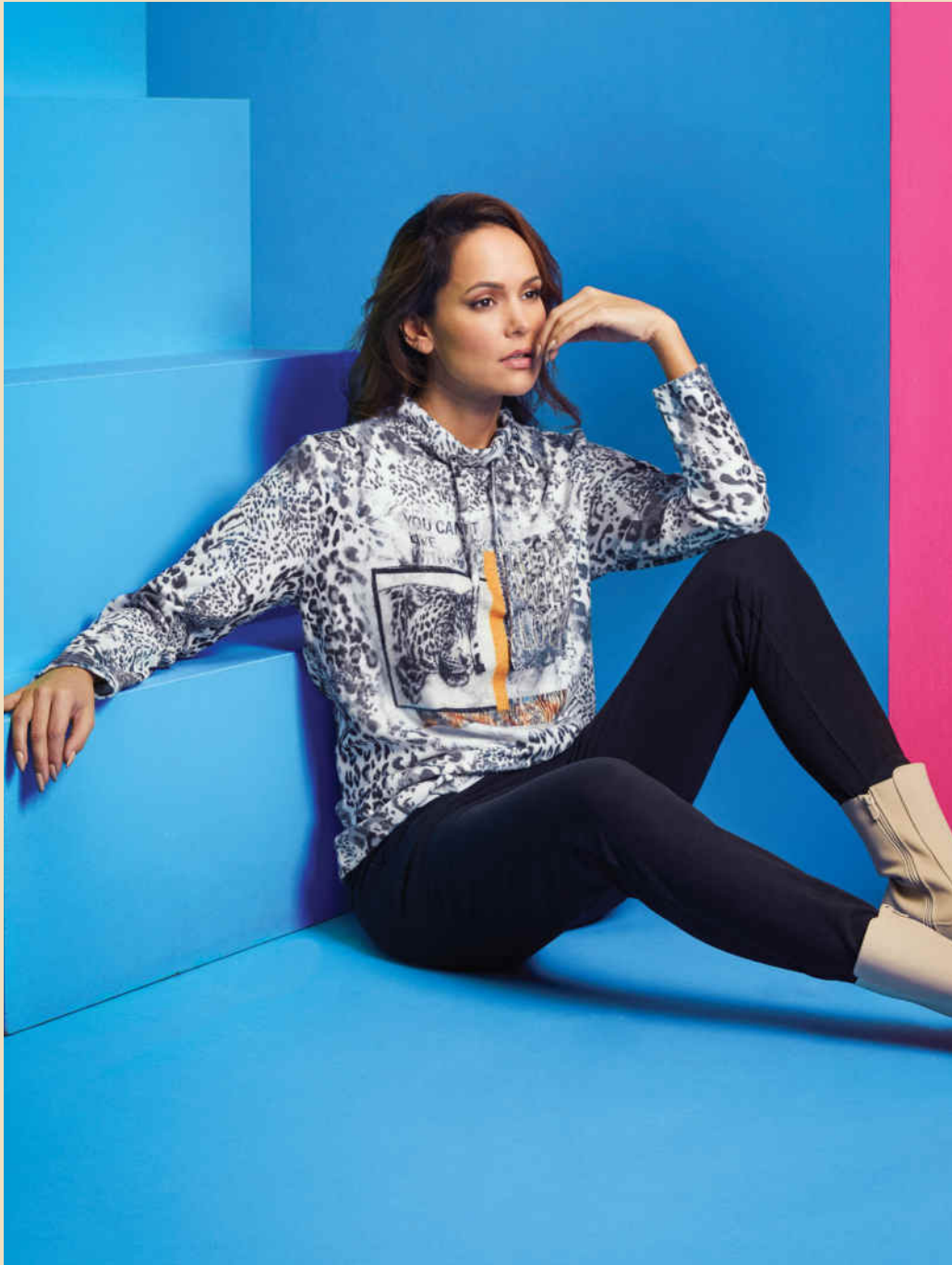
shirt SOMALIA pants THORE